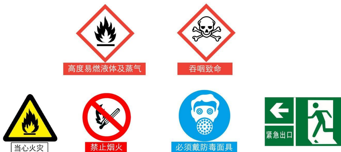
图F.1 图形标志的基本形式示例