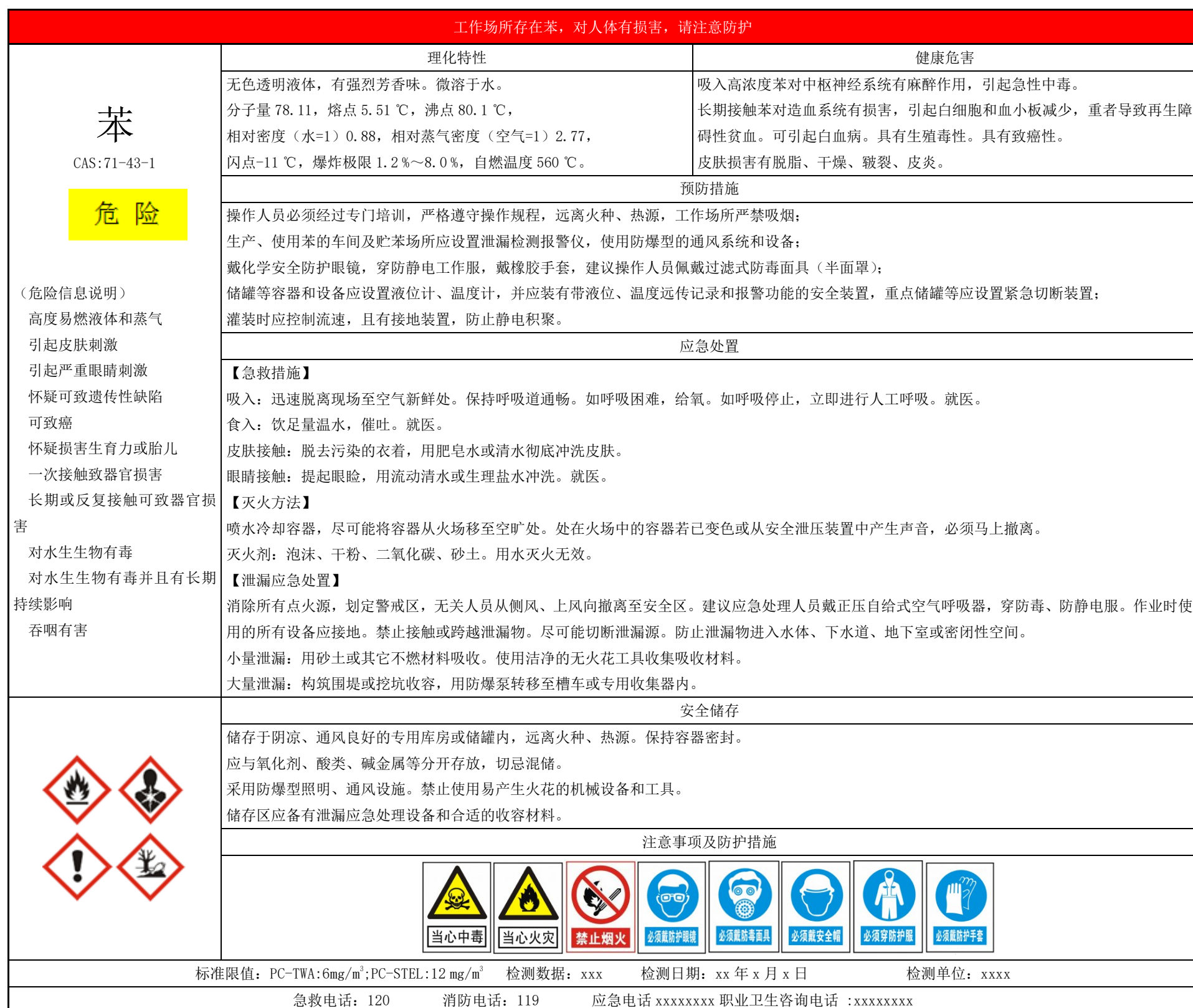
表 G.1 危险化学品及职业病危害警示标志示例

说明：资料性附录属于参照执行内容，企业可以在满足本文件正文要求的基础上自行设计模板。